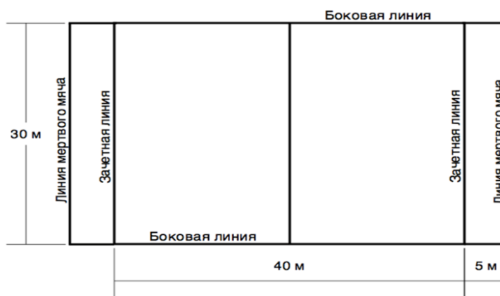
Рисунок 1 - Разметка площадки для игры тэг – регби

Линия зачетного поля - линия, за которую нужно приземлить мяч или забежать с мячом (если это предусмотрено правилами)